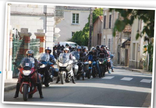
Rassemblement de motards le 1 er juin pour soutenir l'association ADEL