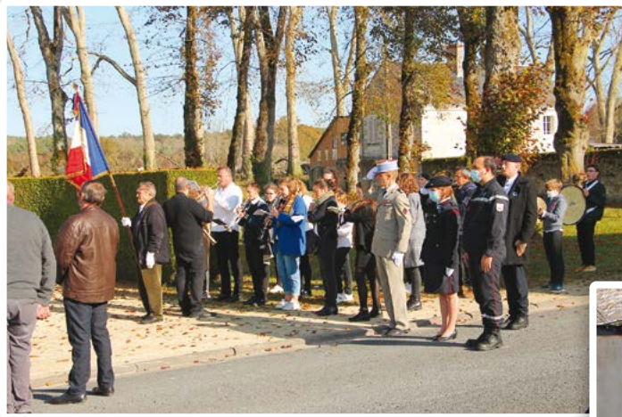
Commemoration du 11 novembre