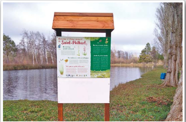
Panneau informatif à l'étang de Saint-Philbert