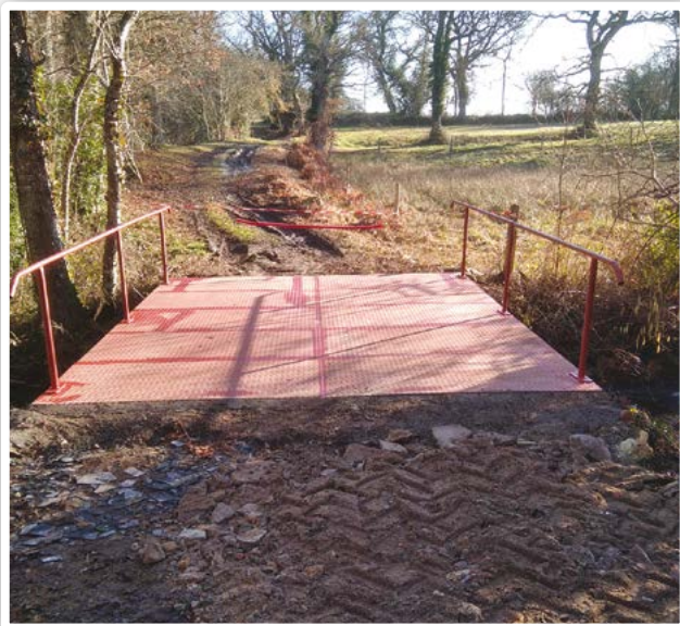
Réfection du Pont de Gravoteau par les agents communaux