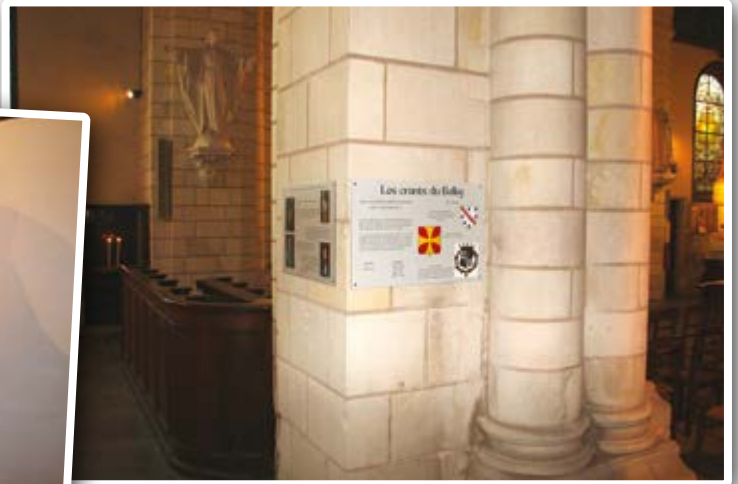
Installation de panneaux d'information sur les orants dans l'église