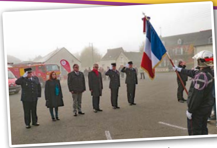
La Sainte-Barbe le 19 novembre