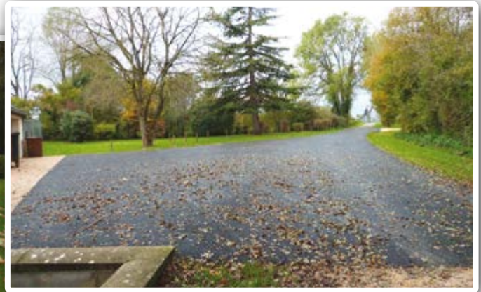
Travaux de voirie autour de la salle Plailly