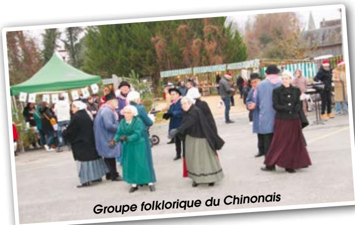
Groupe folklorique du Chinonais

Plus de 50 exposants, commerçants, créateurs, artisans. Le vin chaud a été très apprécié de même que les fouées dans une atmosphère bon enfant... Noël quoi !