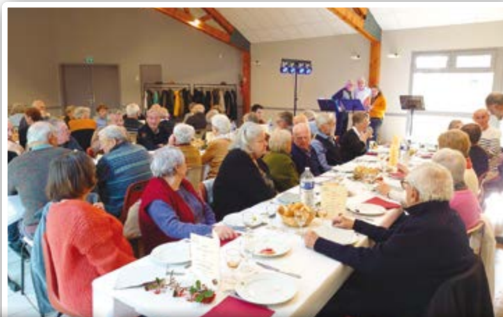
Le banquet des Aînés