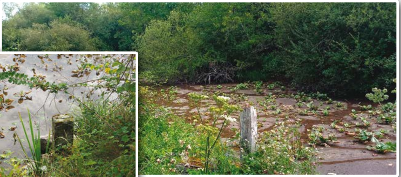
L'étang du Mur à sec