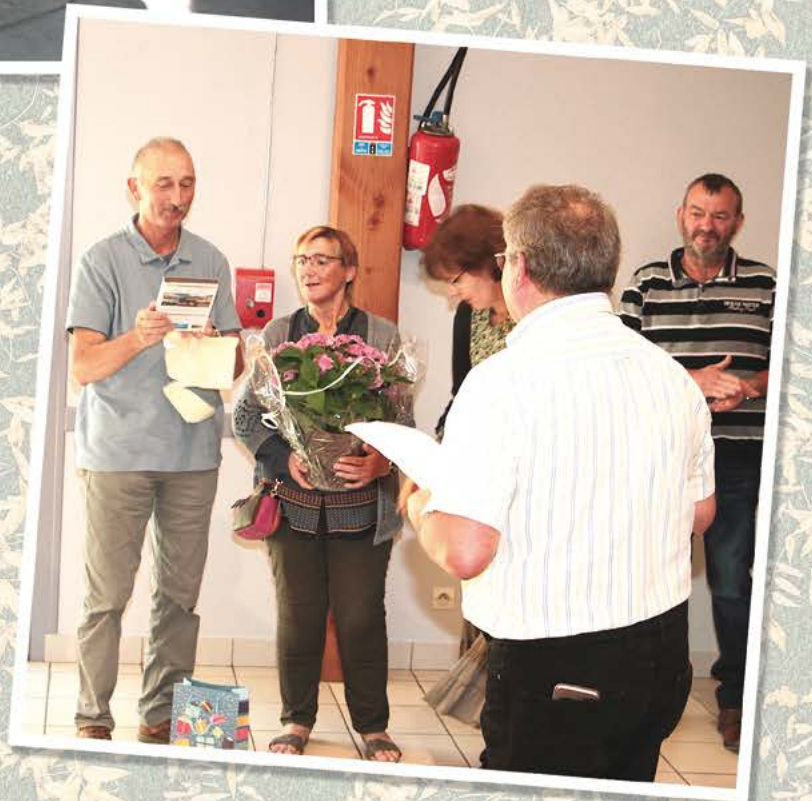
Pot de départ en septembre 2023 et Médaille du travail (35 années)