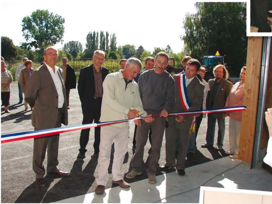
Inauguration du Local technique en 2010